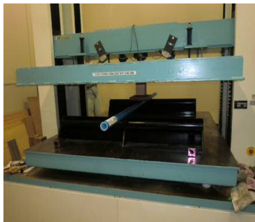
(写真-④) 「曲げ試験時の様子」