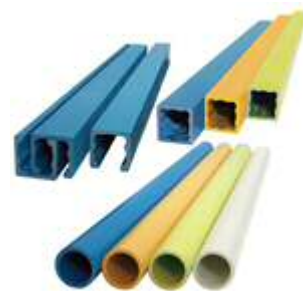
(写真-②) 【仮設FRPパイプ写真】