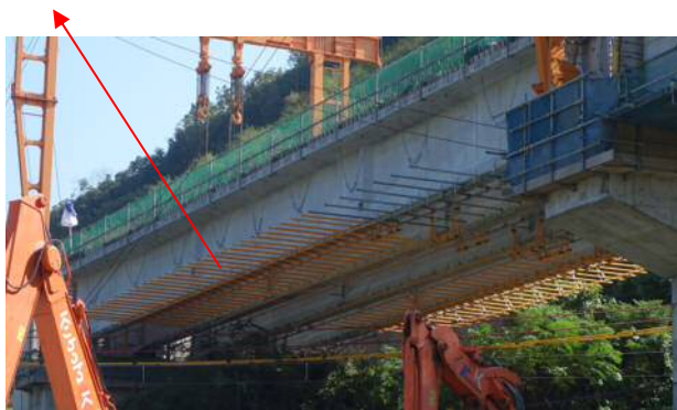
(写真-①) 【跨線橋現場写真】