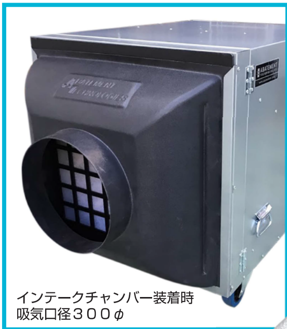
インテークチャンバー装着時 吸気口径300φ