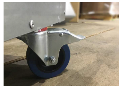
大きなキャスターで動きも快適