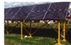
電気室内の 仮設として