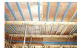
太陽光発電の 架台