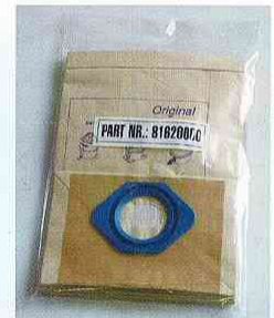
ダストパック (5枚入り)